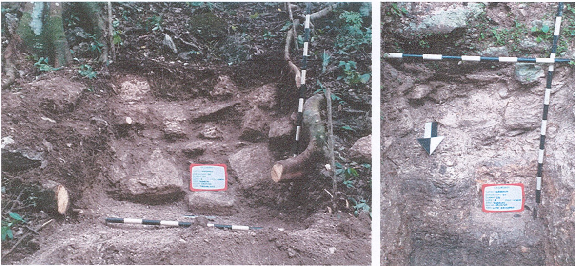
Fig. 1. Piedras colapsadas registradas en la excavación de la unidad 50-7 –izquierda– y segmento del muro de la fachada norte de la Estructura B20 identificado en la unidad 01-26 –derecha–.

Dentro de las actividades de gabinete se dio seguimiento al catálogo de las fotografías continuando con las unidades 01-29 y 01-30, se identificaron veinte (20) para cada una, ascendiendo a un total de cuarenta (40) fotografías que incluyen la descripción, número correlativo y autor. Se finalizó la Memoria de actividades de campo y el informe técnico de campo que incluye la descripción, fotografías y dibujos de las unidades de excavación supervisadas en los meses de contratación, del mes de agosto al mes de diciembre del presente año. Finalmente los dibujos de las excavaciones fueron digitalizados e incluidos en la memoria antes descrita.